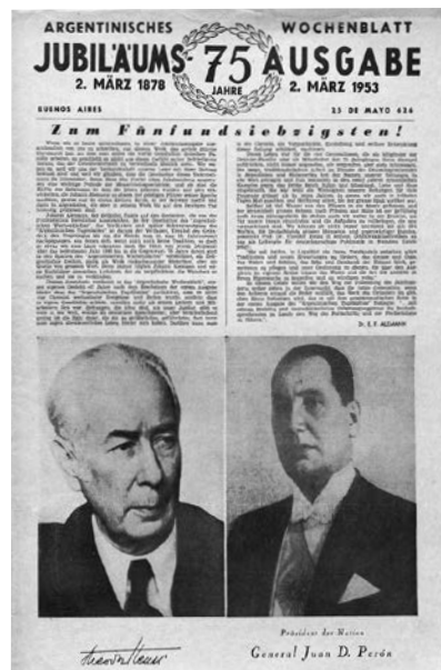
Imagen 1 Der Argentinische Bote año 1, núm. 38, 3 de octubre de 1874. Imagen 2 Argentinisches Wochenblatt 2 de marzo de 1953. Ambos están disponibles on line en el sitio del Centro DIHA https://dihadigital.unsam.edu.ar/index.php/coleccion-de-periodicos

Lo complementan diversas publicaciones donadas por haber sido editadas o utilizadas por la compañía, incluyendo su primer periódico Argentinischer Bote (publicado entre 1874 y 1875 y del cual se conservan todos los números a excepción del 1° del segundo año) [imagen 1], así como varios números del Argentinisches Wochenblatt (editado desde 1878 hasta 1967) [imagen 2] y del Argentinisches Tageblatt (publicado en forma física entre 1889 y 2023) que completan el acervo de la Biblioteca Nacional Mariano Moreno en Buenos Aires. También incluye libros escritos o consultados por los distintos directores de la empresa, muchos de ellos editados por la propia compañía.