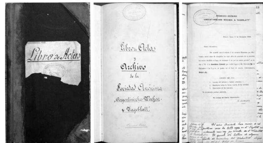
Imágenes 3 a 5 Libro de Actas.

Entre la documentación administrativa de la compañía se incluyen libros de sueldos y jornales, registros de empleados y obreros, libros especiales (según el artículo 56 de la Ley Nacional 20.744 y la Ley Nacional 9.688), fichas de empleados, libros de actas de asambleas [imágenes 3 a 5] desde la primera en 1889, memorias y balances anuales, libros contables y correspondencia. También actas legales por conflictos laborales de empleados con la empresa, una escritura, el certificado de constitución de la Sociedad Anónima “Alemann y Cía. Limitada. Sociedad Anónima Gráfica” en 1929 y los estatutos de la compañía. Además, hay fotografías de los edificios de los primeros talleres gráficos. Contiene asimismo una acción del Argentinisches Wochenblatt y del Tageblatt adquirida en el año de fundación del AT, 1889.